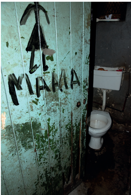
Johannesburgs Inner City huser mange hundre tusen fattige som lever i nedverdige forhold. Her ser vi ett av de få damedoene for de rundt 200 beboerne i en av de falleferdige blokkene.