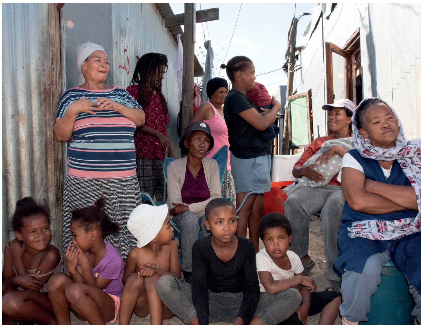
Fra slumbyen New Rest som familier har måtte flytte til etter at de mistet både jobb og bolig hos de store landeierne. Mange har bodd her i ti år i påvente av at myndigheten skal skaffe dem et bedre bosted. Men lite skjer.

– Det kan virke så selvfølgelig for oss. Hvordan skal vi fortelle folk i Norge at vi burde ligge langflate av takknemlighet hver eneste dag for at vi har trukket en hel bøtte med vinnerlodd? Ikke bare har vi olje og fisk, vind og andre ressurser, men folk som har sett at det er viktig å bygge ned ulikhetene i samfunnet, sier han.