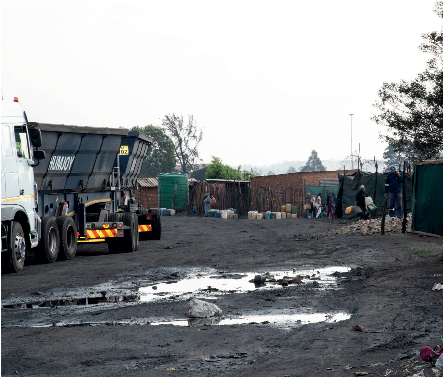
I Witbank bor folk tett på gruvene, og opplever at både strøm og vann kun er til for at kullet skal utvinnes og vaskes. Det de sitter igjen med er forurenset luft og en mengde sykdommer fra de farlige støvet.

vi kjører forbi sprukne murhus og skur av bølgeblekk i Phola. Vi passerer skiltet hvor gruveselskapet stolt proklamerer: «Comitting to adding value to the community».