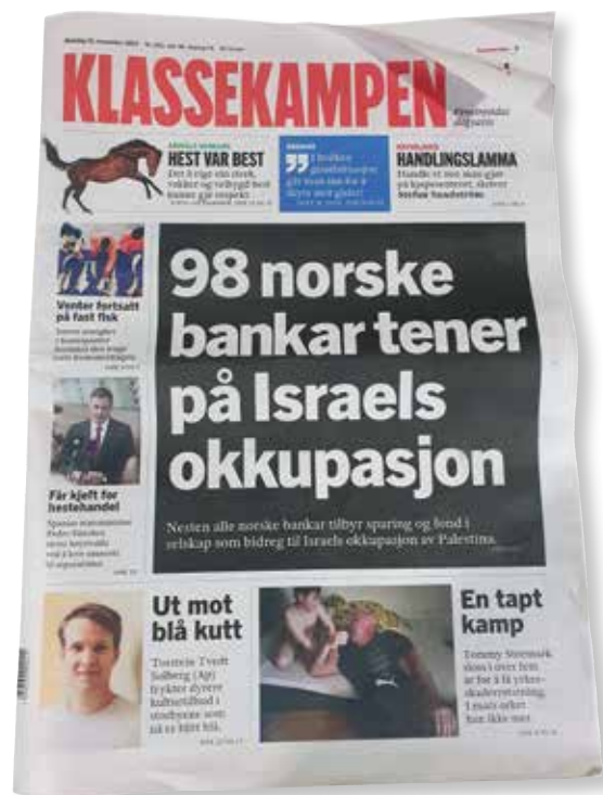
Klassekampens forside mandag 13. november 2023

Krigen i Gaza førte til mer oppmerksomhet på Stortinget om flere av sakene samarbeidsprosjektet har jobbet med i lang tid. Disse inkluderte krav om forbud mot bosettervarer og -tjenester, press for å få Oljefondets investeringer ut av okkupasjonen, krav om norsk tilslutning til FNs apartheidkonvensjon og anerkjennelse av Palestina som egen stat. Stortinget vedtok «å be regjeringen være forberedt på å anerkjenne Palestina som en egen stat på et tidspunkt der en anerkjennelse kan ha positiv innvirkning på en fredsprosess og uten forbehold om en endelig fredsavtale». Samarbeidsprosjektet har også bistått med bakgrunnsinformasjon til flere parlamentariske spørsmål.