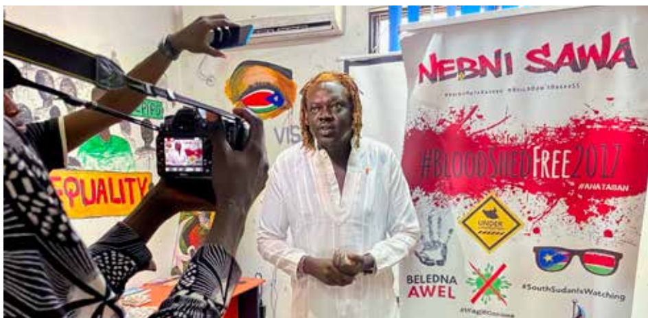
Anataban kjemper for likestilling og større rettigheter for ungdom.

Norsk Folkehjelp. Vi har sett fram til dette møtet med en lokal partnerorganisasjon.