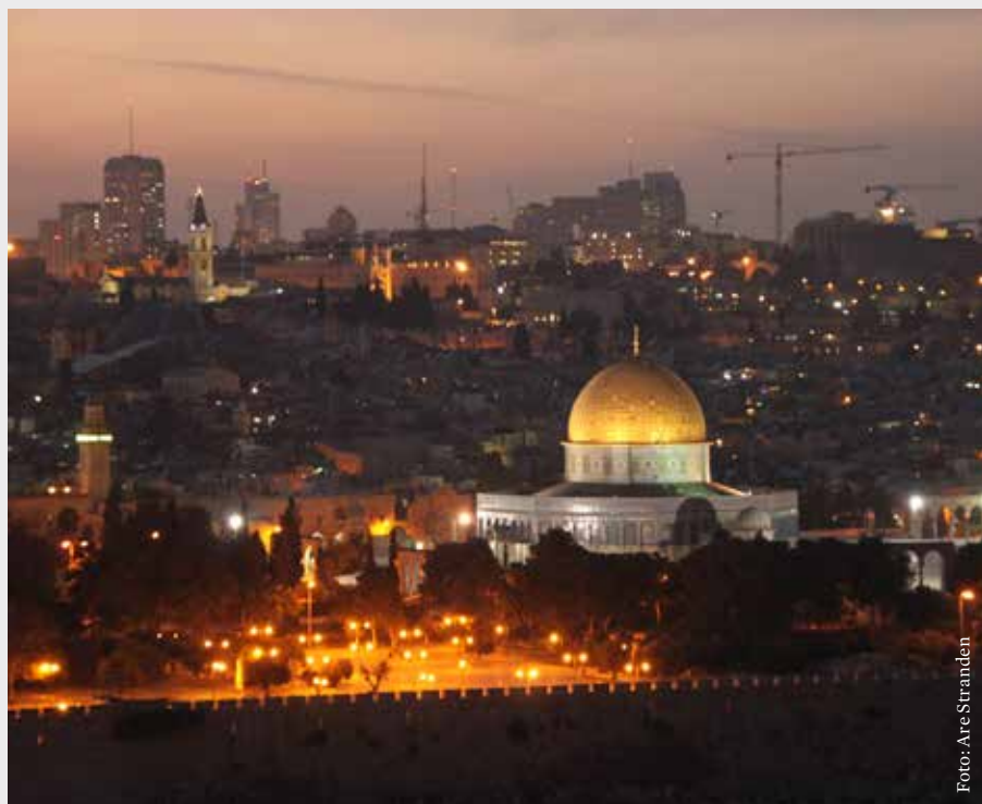
Klippemoskeen på Tempelhøyden i Gamlebyen i Jerusalem.

Du er skyldig til det motsette er bevist.