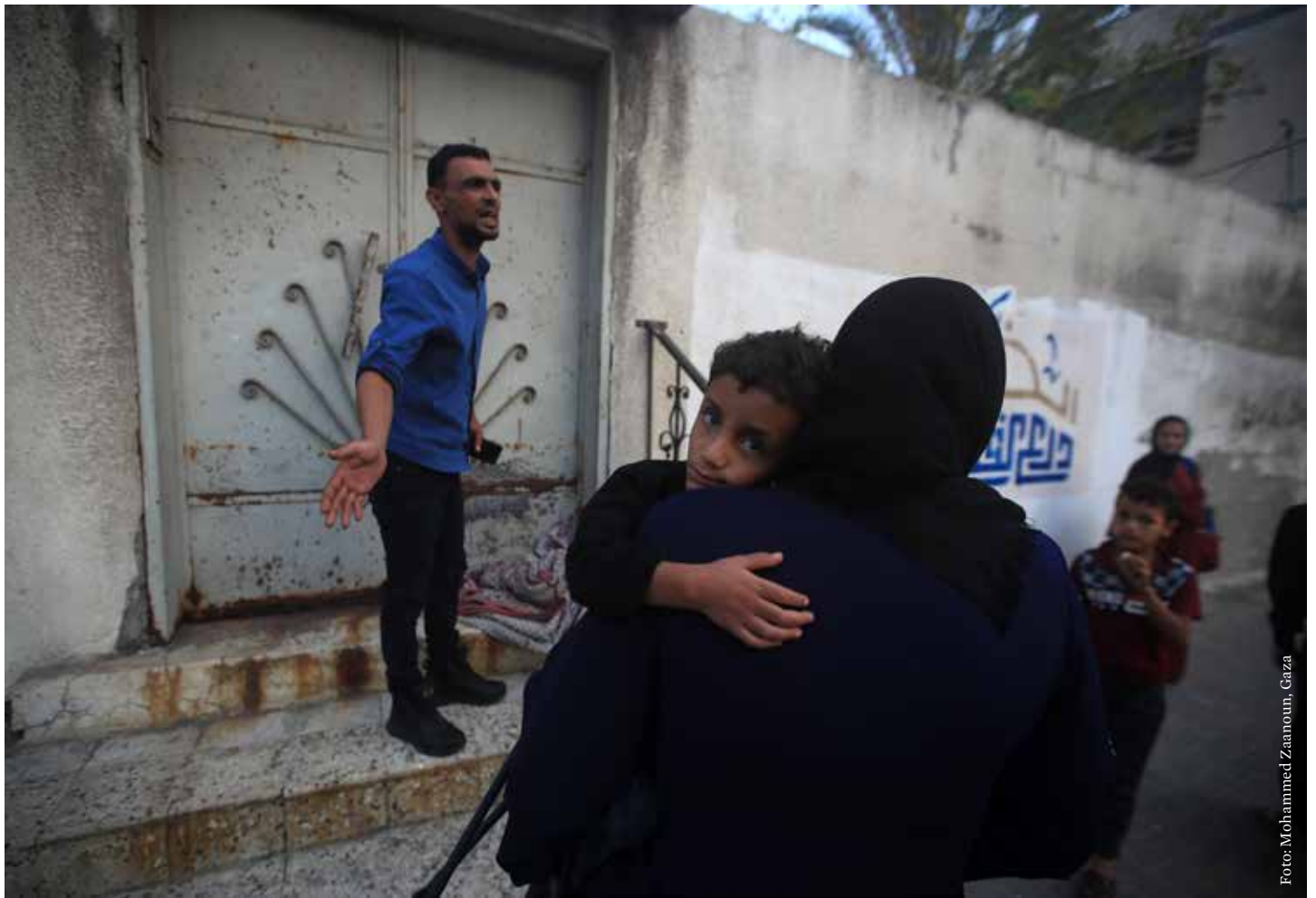
I Gaza forsøker alle som best de kan å beskytte barna sine.

Det er lite spillerom for sivile aktører i Palestina. Både Fatah og Hamas frykter en fri debatt, og knebler ytringsfriheten i det palestinske sivilsamfunnet. Israels terrorstempling av sju internasjonalt anerkjente, palestinske rettighetsorganisasjoner i 2021 og full nedstengning av dem i 2022, har medført alvorlige tilbakeslag for arbeidet i regi av disse organisasjonene.