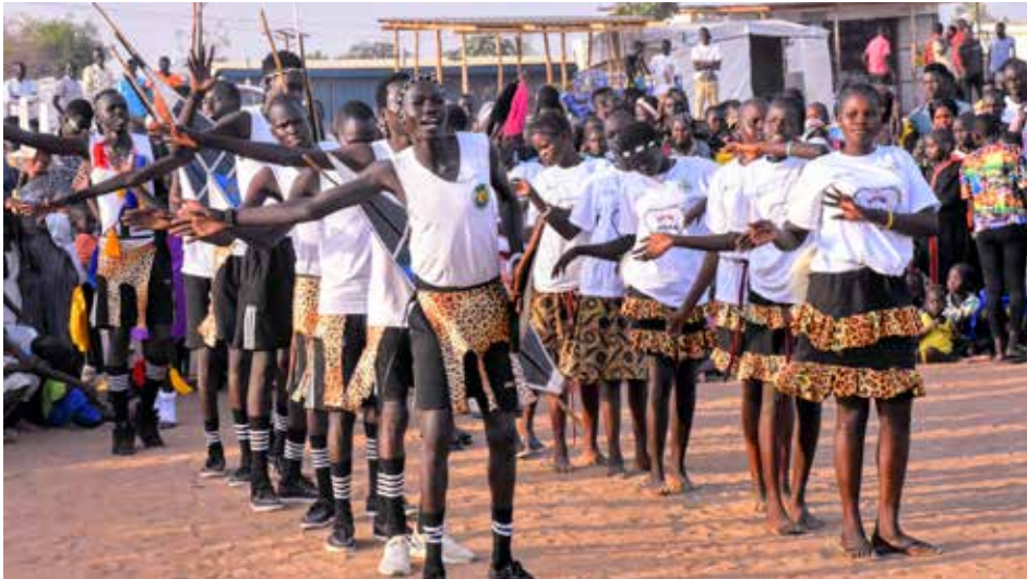
Kultursamling i regi av Active Citizen South Sudan. Folk fra ulike stammer møtes i en stor flyktningleir i utkanten av hovedstaden Juba.