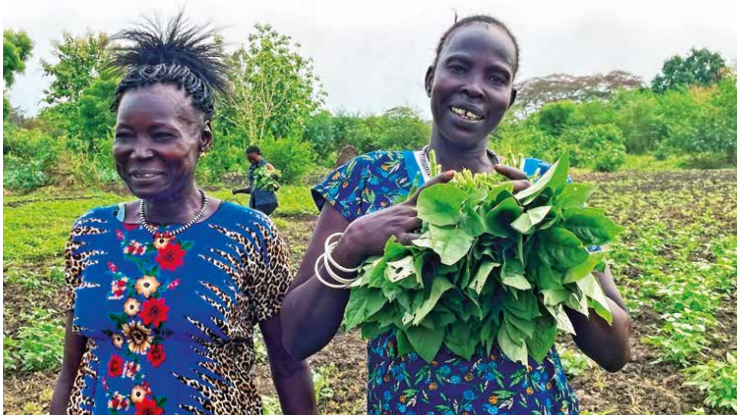
Stolte kvinner på øya Gondokoro i Nilen driver vekselbruk og dyrker grønnsaker på en bærekraftig måte.

På Gondokoro Island er det å sende barna i barnehage og på skole en stor utfordring, selv om mødrene nå har nok til å dekke skolepengene. På øya finnes det ingen skole eller helsetilbud, de må krysse Nilen for å