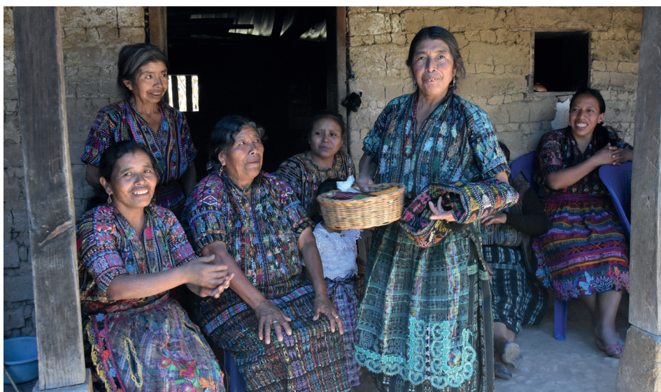
Urfolkskvinnene i Guatemala spiller en viktig rolle i kampen for et tryggere og mer rettferdig samfunn, der alle har lik tilgang til offentlige tjenester og kan delta i beslutningsprosessene.

Våre partnere har etablert arenaer for å utvikle felles strategier for å bidra til en forbedring av politikk og lover for å sikre urfolks territorielle rettigheter, deres rett til å bli hørt, forsvar av naturressurser, tilgang til land og vann, og styrking av likestilling og kvinners rettigheter. Organisasjonene bruker medier, radio og TV for å informere, ta opp problemer i lokalsamfunnene og påvirke offentlige debatter og politikk.