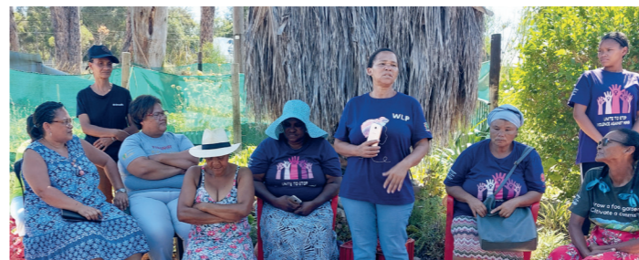
Norsk Folkehjelps samarbeidspartner Women on Farms – som støttes av FLT – arbeider for å bedre forholdene for kvinnelige gårdsarbeidere.

Norsk Folkehjelps samarbeidspartnere i Sør-Afrika har vunnet fram i flere viktige saker i 2023. De har blant annet sikret at gårdsarbeidere og slumbeboere har fått nye boliger etter at de ble truet med utkastelse fra sine hjem, og de har forhindret gruvedrift som ville ha ødelagt lokalsamfunn.