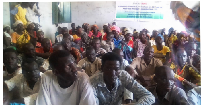
Deltakere på kampanje for bevissthetsøkning petroleumslovene i Rubkona

UASN organiserte en kampanje i Jonglei for å øke kvinners bevissthet om sine rettigheter, og utfordringene som påvirker dem i de oljeprodukerende fylkene, for eksempel begrenset adgang til rent vann og andre grunnleggende sosiale tjenester. Kampanjen involverte hundre kvinner. UASN avholdt også en firedagers strategisk planleggingsworkshop for ansatte og styremedlemmer i november 2018, med 18 deltakere, og organiserte et prosjektverksted tidlig i 2018.