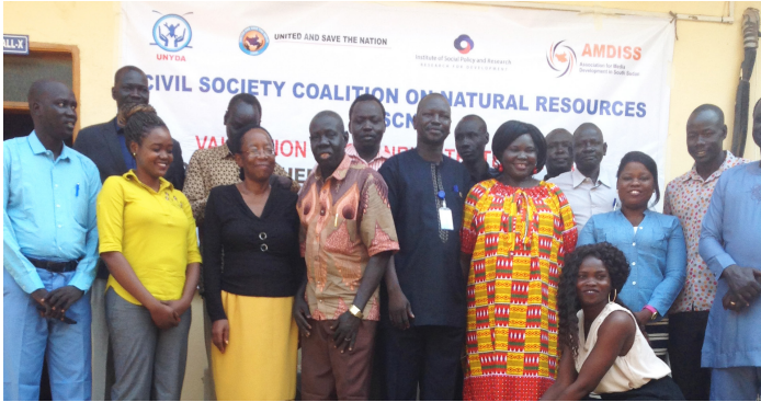
Medlemmer i CSCNR på strategisk planleggingsseminar

Petroleumsindustrien i Sør-Sudan har gjenoppstartet mye aktivitet som ble satt på vent når konflikten var mer aktiv. Blant annet ble oljefeltene i Unity-distriktet, der produksjonen ble stoppet på grunn av borgerkrigen, gjenåpnet høsten 2018.