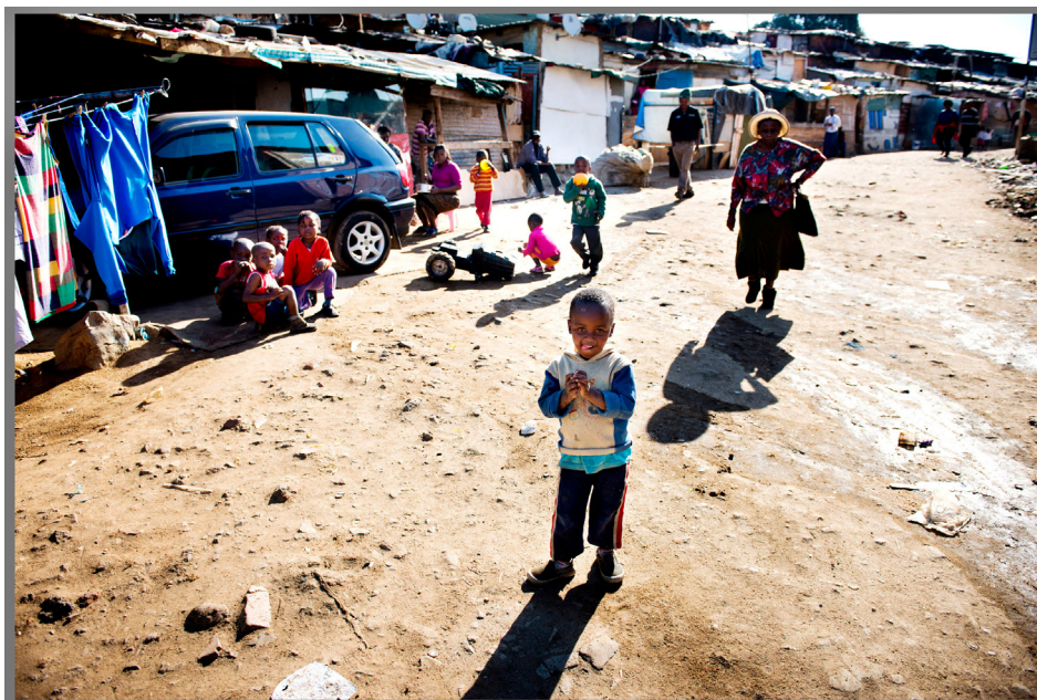
I valget i mai 2019 beholdt ANC makten, men fikk lavere oppslutning enn for fem år siden. 25 år etter apartheidstatens fall lever halvparten av Sør-Afrikas befolkning under fattigdomsgrensa.