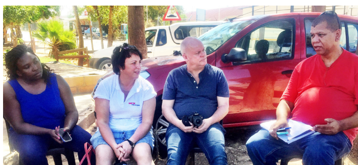
Fellesforbundets støtte til Norsk Folkehjelp og samarbeidspartnerne i Sør-Afrika har vært viktig i de fire årene som har gått. I 2017 besøkte Fellesforbundets ambassadører fagbevegelsen i Johannesburg.