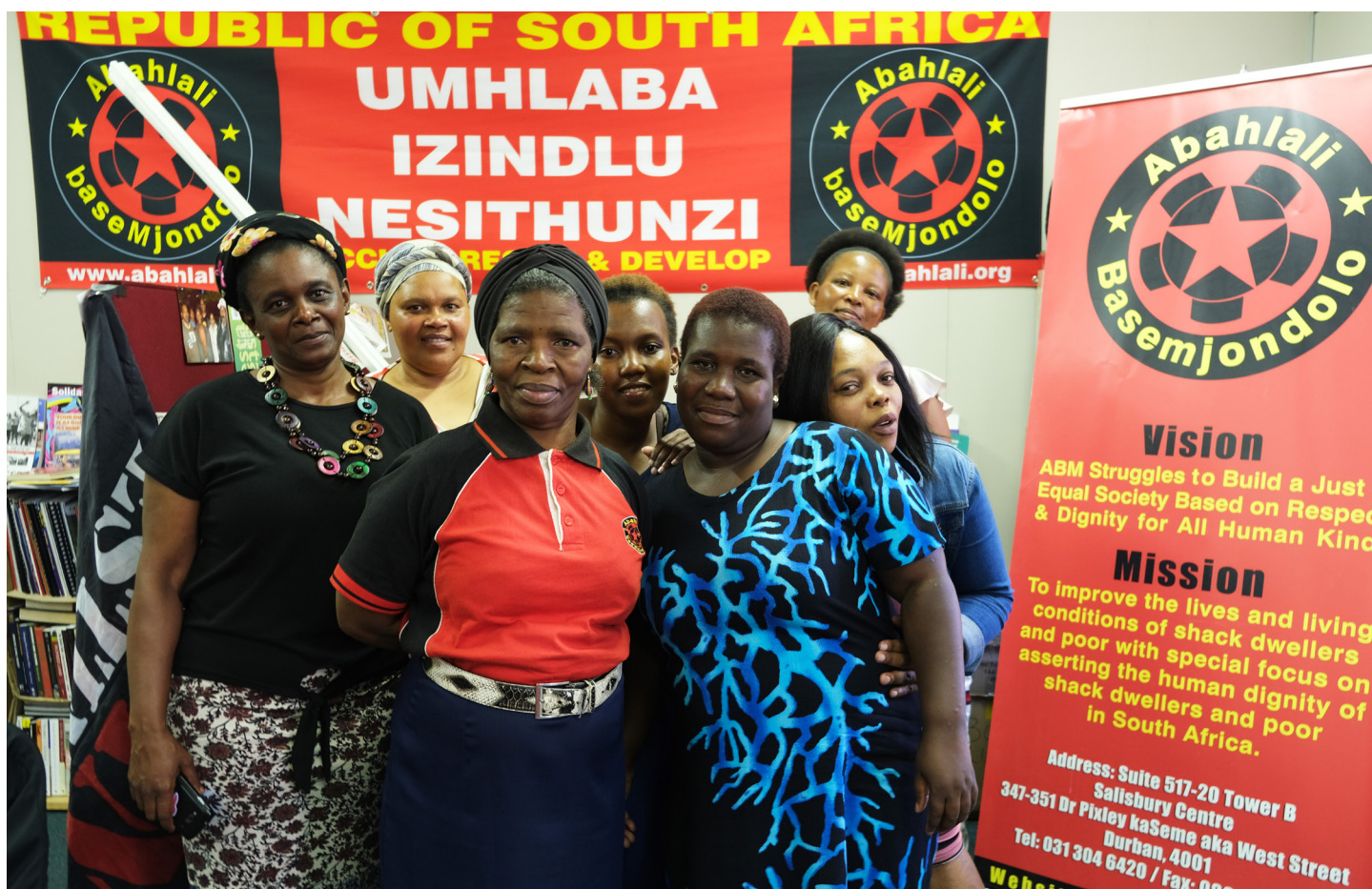
De viljesterke medlemmene i Abahlali baseMjondolo ivaretar slumbeboernes rettigheter, og gir ikke opp selv om de utallige ganger har blitt jaget fra hjemmene sine. I juli 2017 vant lokalsamfunnet eNkanini fram i Durbans øverste domstol, og det siste året har boligene deres fått stå i fred.