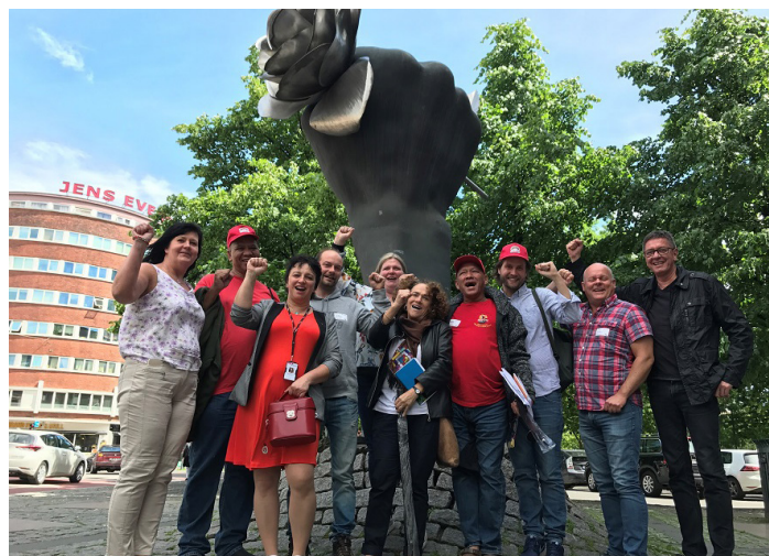
Gleden var stor på Lilletorget da det sørafrikanske fagforbundet CSAAWU i 2017 ble tildelt Arthur Svenssons internasjonale pris.

CSAAWU vant prisen for sin ustoppelige kamp for anstendige arbeidsvilkår for en særdeles utsatt gruppe i arbeidslivet og for sin evne til omfattende grasrotorganisering på tross av meget knappe ressurser. Prisen er opprettet av forbundet Industri Energi, og deles ut årlig av Komiteen for Arthur Svenssons internasjonale pris for faglige rettigheter.