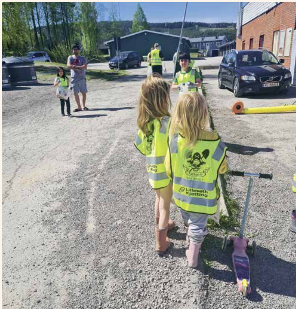
↑ PLASTPIRATER: Ekte plastpirater på jobb i Kongsvinger.

– Vi har vært med de tre siste gangene. Hele 600 plagg byttet eier bare i Kongsvinger.