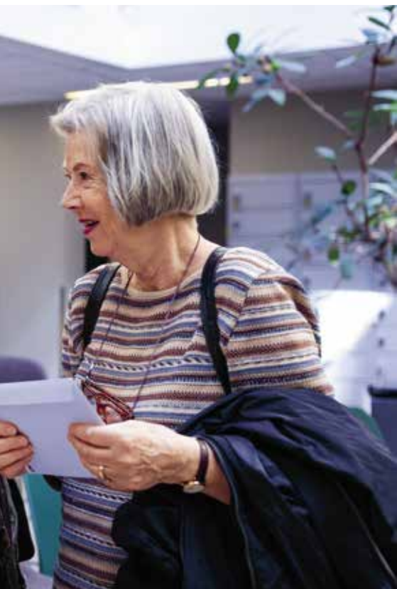
er en berikelse å møte folk fra andre land og kulturer.