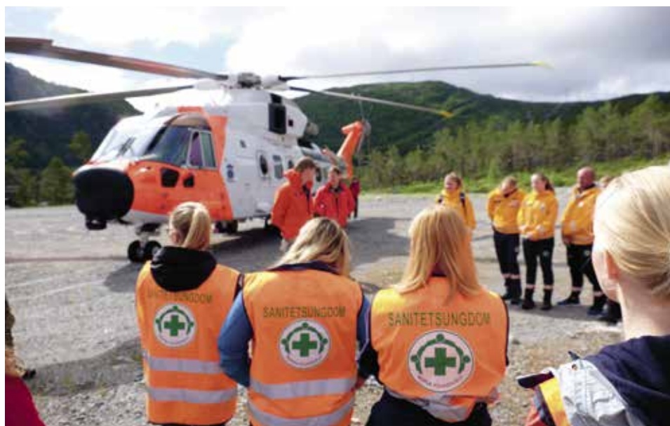
PLAN B: Planen var egentlig at et redningshelikopter av typen AW1010 skulle møte ungdommene på Preikestolen. Det gikk ikke, men heldigvis fikk de besøk av helikopteret et par dager senere.

Siden grå skyer lenge hadde ligget tungt over leiren, ble timeplanen straks endret den ene dagen sola tittet fram. Glimtet av finvær ble benyttet til bading.