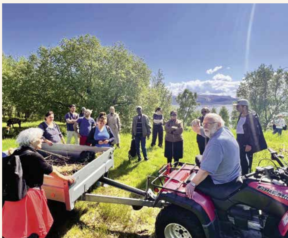
↑ BESØK: Det er stor interesse for Bodø Økologiske Besøkshage.

da kom de bort til oss med en gang. Det var veldig fint, forteller Abdallah.