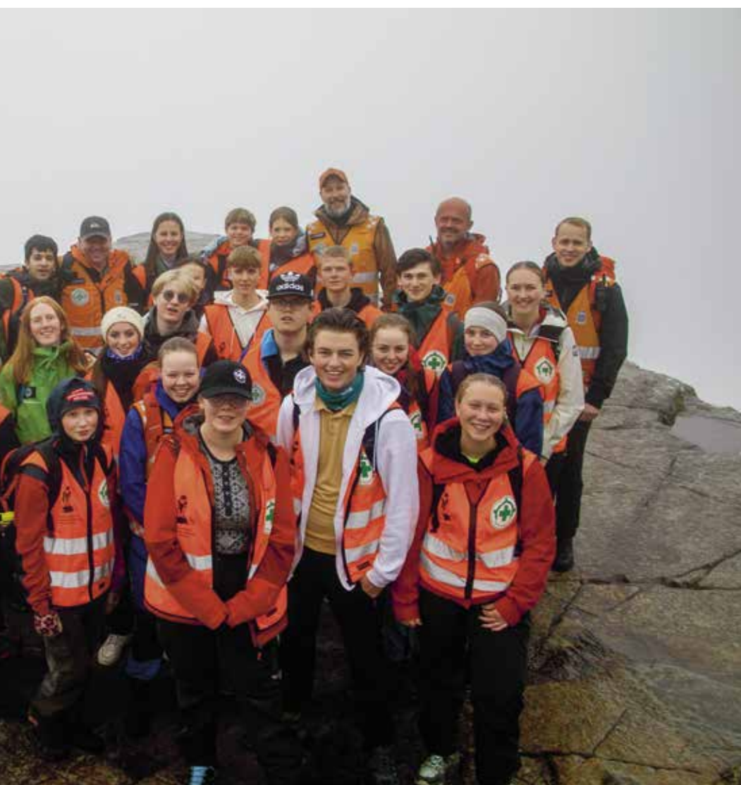
Her gikk de glipp av panoramautsikten over Lysefjorden og Frafjordheiene.

plassen for redningshelikopteret her oppe klargjøres og markeres.