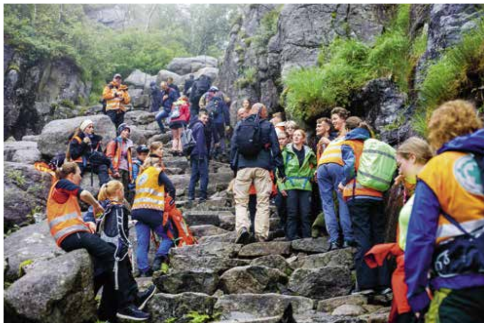
SHERPATRAPPER: Det ble tid til en rast i steinura med «sherpatrapper».