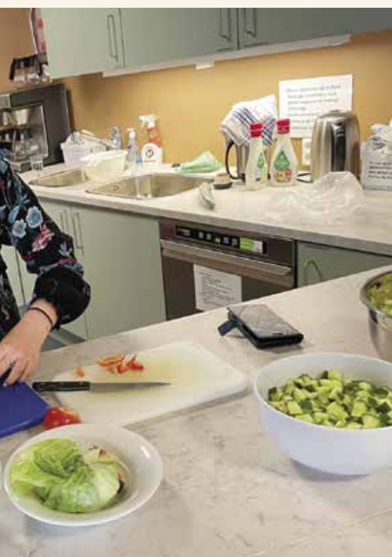
...mmen i ungdomsgruppa i NF Sunnhordland på fredager