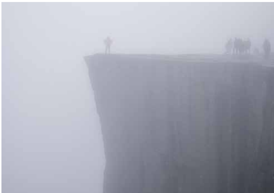
TÅKE: Preikestolen er flott, også i tåke.