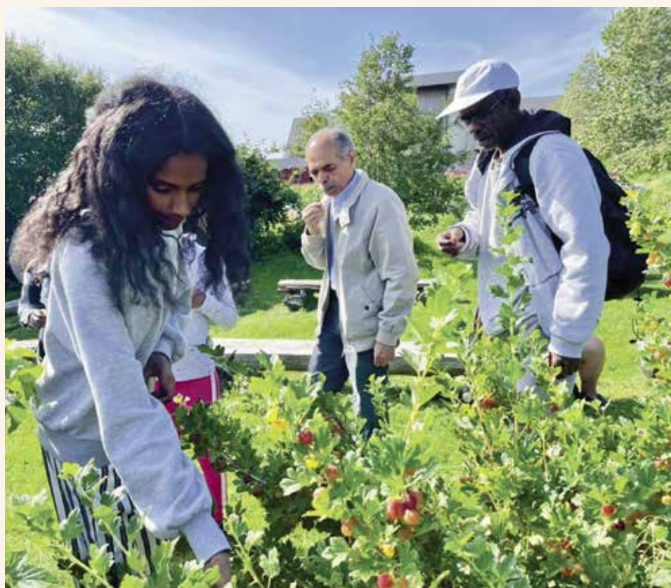
↑ ØKOLOGISK MATPRODUKSJON: Opplæring i Bodø økologiske hager.

ØKOLOGISK MAT. I tillegg til potetdyrking er Bodø-laget opptatt av ulike temaer som dreier seg om matproduksjon, som «Brød», der alle deltakerne får i oppgave å finne fram en oppskrift på brød fra sitt hjemland. På den måten lærer alle om ulike typer korn og mel, og hvordan de kan bake sitt eget brød. De blir