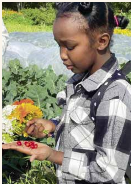
↑ BLOMSTER OG BÆR: På besøk i Bodø økologiske hager.

Det er et veldig bra tiltak, og vi har bare fått gode tilbakemeldinger. Barna blir også mer og mer engasjerte i dette, forteller Olsen.